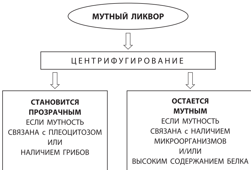
Рис. 2. Причины помутнения ликвора

Легкое помутнение СМЖ наблюдается при количестве лейкоцитов — более 200 \times 10^6/\text{л} , эритроцитов — более 400 \times 10^6/\text{л} , а общего белка — более 3 г/л.